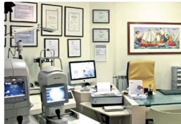
Controllo Vista Strumentazione all'avanguardia

Oggi con le lenti a contatto potrai vedere da vicino & lontano.