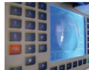
Lavorazione computerizzate Il massimo della precisione

Le lenti vengono analizzate per verificare i valori diottrici e il filtraggio di frequenze e di raggi UV.