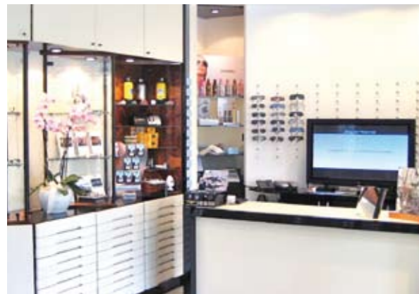
Spazi dedicati per la scelta delle montature Dai classici alle avanguardie stilistiche