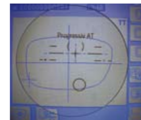
Tecnologie all'avanguardia Personalizzazione della correzione